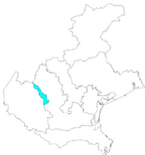
Figura 1 - Territorio interessato nella Regione Veneto

Nella Figura 2 è raffigurata la planimetria dell'ATO Valle del Chiampo con l'individuazione dei territori in cui operano i 2 gestori dei servizi idrici: