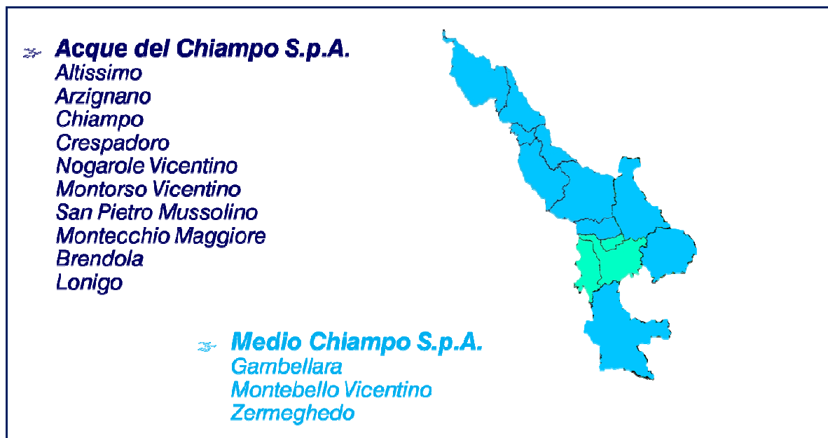
Figura 2 - Territorio dell'ATO Valle del Chiampo