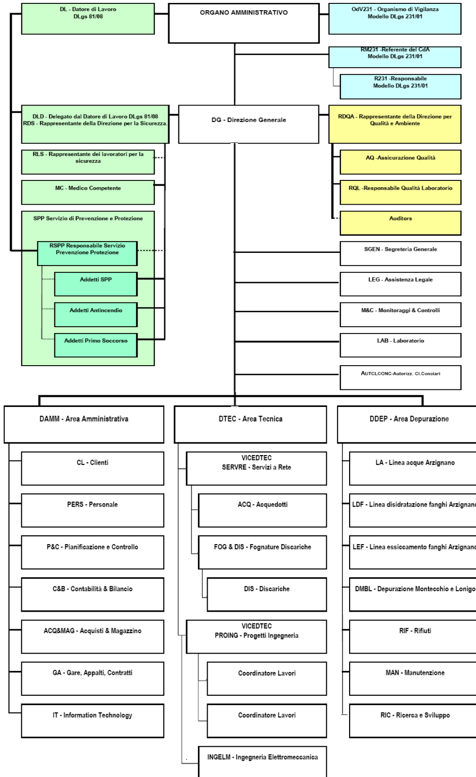
Tabella 1 - Organigramma di Acque del Chiampo. al 31/12/2013